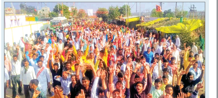
सिद्धिगंजा। हिंदू उत्सव समिति और समस्त ग्राम वासियों द्वारा अयोध्या में राम मंदिर निर्माण होने पर मूर्ति की प्राण प्रतिष्ठा होने पर समस्त ग्राम वासियों द्वारा ग्राम के मुख्य मार्ग से होते हुए विशाल चल समारोह बड़े उत्साह के साथ बैड बाजे कीजे के साथ नाचते गाते बड़े धूमधाम से निकला गया। चल समारोह हनुमान मंदिर से प्रारंभ होकर बड़ा बाजार, चमन चौराहा, पुराना थाना रोड, बस स्टैंड, प्राचीन बगवाई माता मंदिर, छोटा बाजार होता हुआ हनुमान मंदिर पहुंचा। जहां पर महा आरती का आयोजन किया गया। वहीं चल समारोह में बड़ी संख्या में ग्रामीण उपस्थित रहे। ग्राम के राम मंदिर खाती मोहल्ला व गाड़ी राम मंदिर, कृष्ण मंदिर चमन चौराहा, राम मंदिर हमली चोक सहित अन्य मंदिरों की पूजा अर्चना कर बंडारे का आयोजन किया गया। ग्रामीणों द्वारा बड़े धूमधाम से चल समारोह निकाला गया।