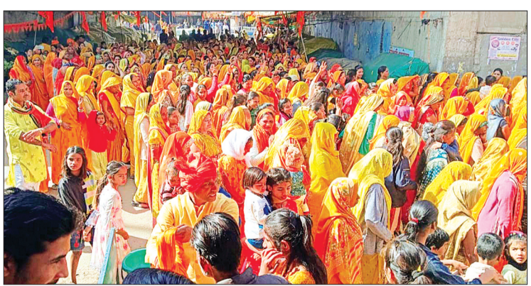
हरिभूमि न्यूज एयामपुर विगत सात दिनों से पूरे देश के सनातनियों के मन मस्तिष्क में अपार उत्साह के साथ-साथ नगर श्यामपुर में और उसके आसपास के क्षेत्रों में भी भव्य श्री राम मंदिर के प्राण प्रतिष्ठा के दिन जगह-जगह विशाल शोभा यात्रा का

आयोजन किया गया श्री राम मंदिर माता चौक से शुरू होकर विशाल सनातनियों की शोभायात्रा नगर में निकाली गई। जिसमें घोड़ा बग्गी ढोल धमाकों के साथ श्री राम की संजीव झांकी के साथ हजारों की संख्या में भव्य और विशाल शोभायात्रा का आयोजन किया गया जिसमें दिव्य ज्योति संस्थान के स्वामी गुरु