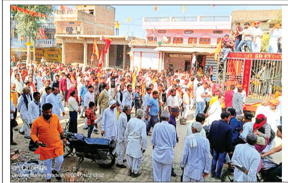
खाचरोद। सोमवार को अयोध्या में भगवान श्री राम के प्राण प्रतिष्ठा समारोह के पावन पर्व पर ग्राम खाचरोद सहित आसपास के सभी ग्रामीण क्षेत्र रामपुर, रोल गांव, छाप, बरदाटी, बड़कोला, अवंली खेड़ा आदि गांव में हवन पूजन व मंडारे का आयोजन किया गया। वहीं सभी गांव में ऐतिहासिक जुलूस निकल गए। ग्राम खाचरोद में राम, लक्ष्मण, जानकी को रथ पर सवार कर कर बैड बाजा के साथ जुलूस निकाला गया। जो ग्राम के राम मंदिर से शुरू होकर ग्राम के प्रमुख मार्गों से होता हुआ राम मंदिर पहुंचकर भगवान राम लाल की आरती की गई। आरती के बाद प्रसाद वितरण की गई। इस मौके पर बड़ी संख्या में ग्राम के सभी भक्तजन उपस्थित थे।