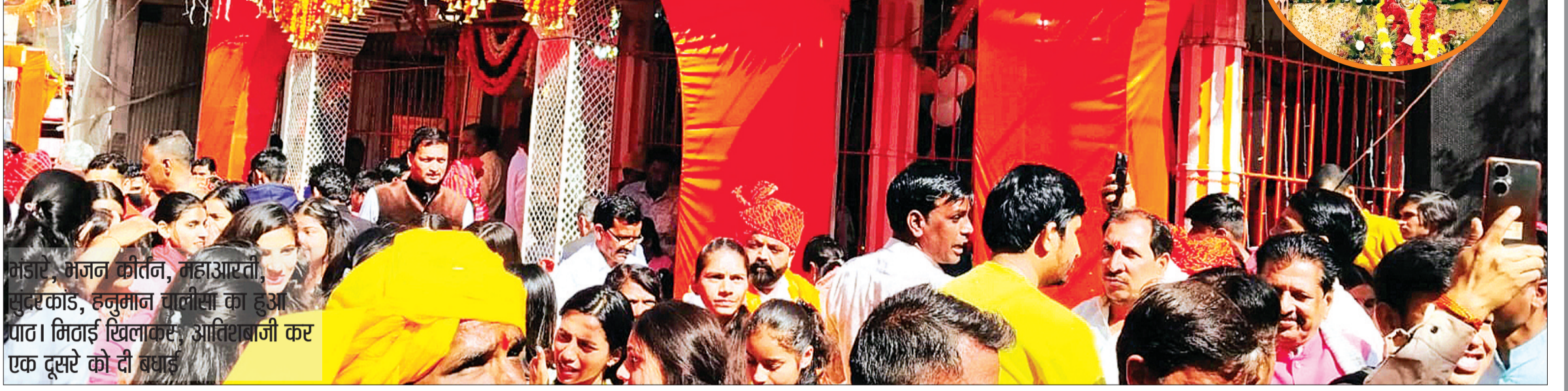
मंडारे, भजन कीर्तन, महाआरती, सुंदरकांड, हनुमान चालीसा का हुआ पाठ। मिठाई खिलाकर आतिशबाजी कर एक दूसरे को दी बधाई