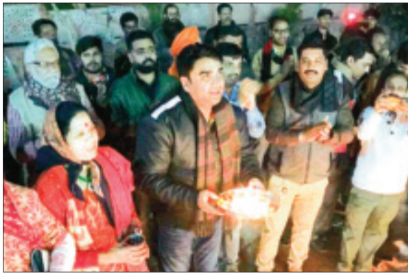
शनिवार की शाम को यहां पर उपस्थित क्षेत्रवासियों ने पूरी आस्था