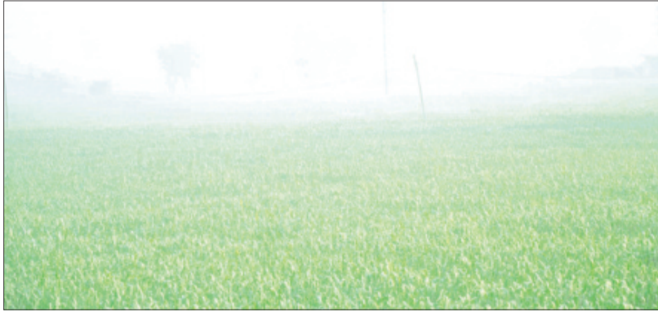
अधिकतम तापमान में कोई विशेष परिवर्तन की संभावना नहीं है। मौसम विभाग ने जारी की गई एहतियात सलाह के अनुसार अधिकांश जगहों पर 14°C-16°C के बीच दर्ज किया जा रहा है। इसके साथ ही अगले 5 दिनों के दौरान राज्य के कुछ जगहों पर घने कोहरे का भी पूर्वानुमान है। मौसम के प्रभाव तथा सुझाव के अनुसार शीत दिवस की स्थिति के कारण अपेक्षित प्रभाव फल, बहती बंद नाक या नाक से खून आना जैसी विभिन्न बीमारियों की संभावना बढ़ जाती है, जो आमतौर पर शुरू होती है या लंबे समय तक ठंड के संपर्क में रहने के कारण बढ़ जाता है।

बर्फाली ठंडी पछुवा एवं उत्तर-पछुवा हवा का प्रवाह होने का कारण है और इसके साथ ही समुद्र तल से 12.6 किमी ऊपर 140-160 नॉट क्रम की जेट स्ट्रीम हवाएं उत्तर भारत के मैदानी इलाकों पर कायम है। जिसके प्रभाव से 24 जनवरी तक शीत दिवस की स्थिति बने रहने की संभावना है। इसके साथ ही राज्य में न्यूनतम तापमान 2°C-3°C तक क्रमिक गिरावट के साथ 10°C से कम रहने की संभावना है।